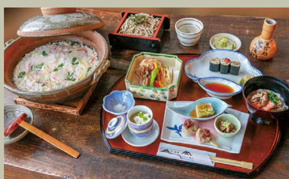
蕎麦懐石膳 2,800円(税別)