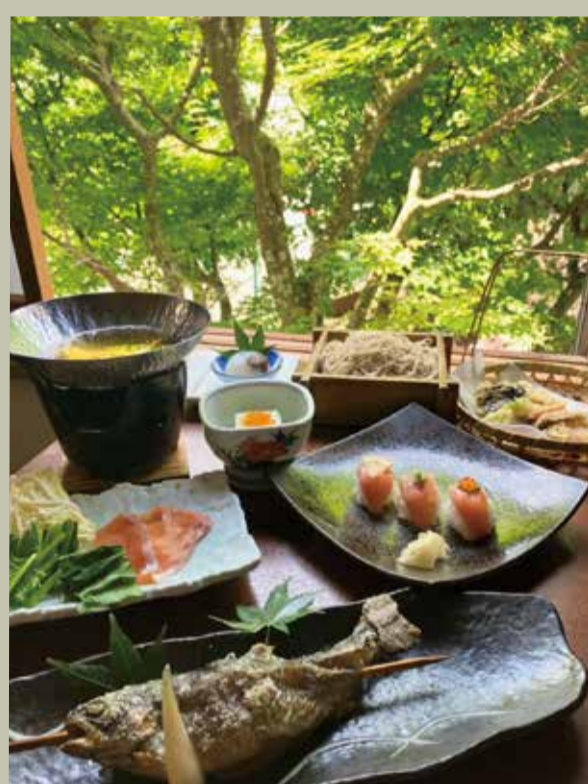
紅富士御膳 3,300円(税別)